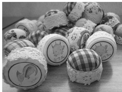
今日の作品 ~オリジナル針山~