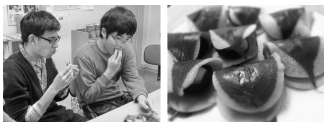
みんなでいちご入りのさくら餅を作りました